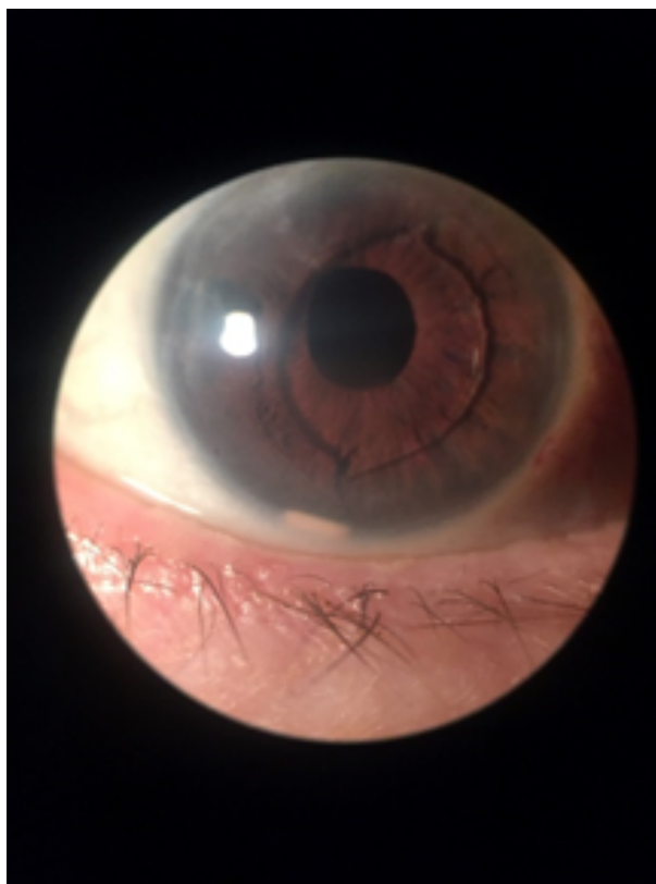
Figura 1. Exame de biomicroscopia mostrando lente intraocular de câmara anterior e fragmento do implante de corticoide inferiormente.